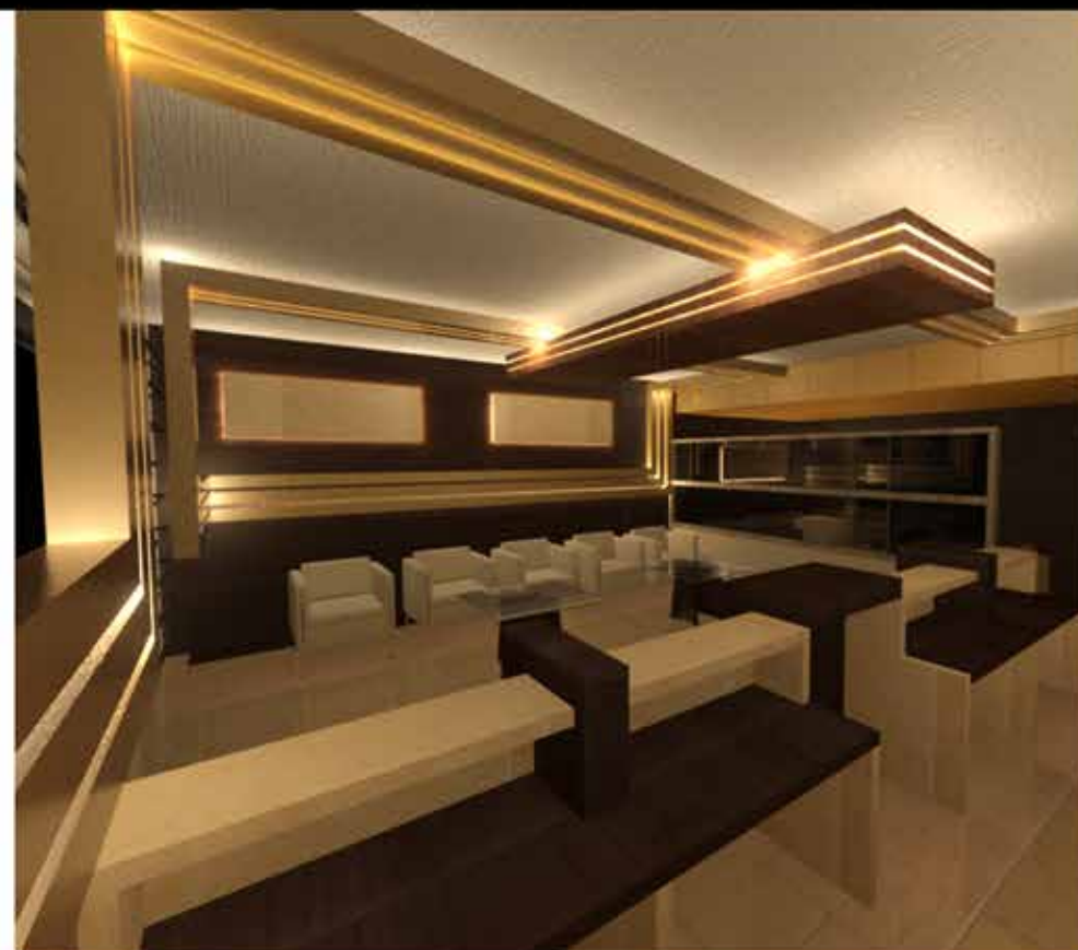
● صرافی BGW