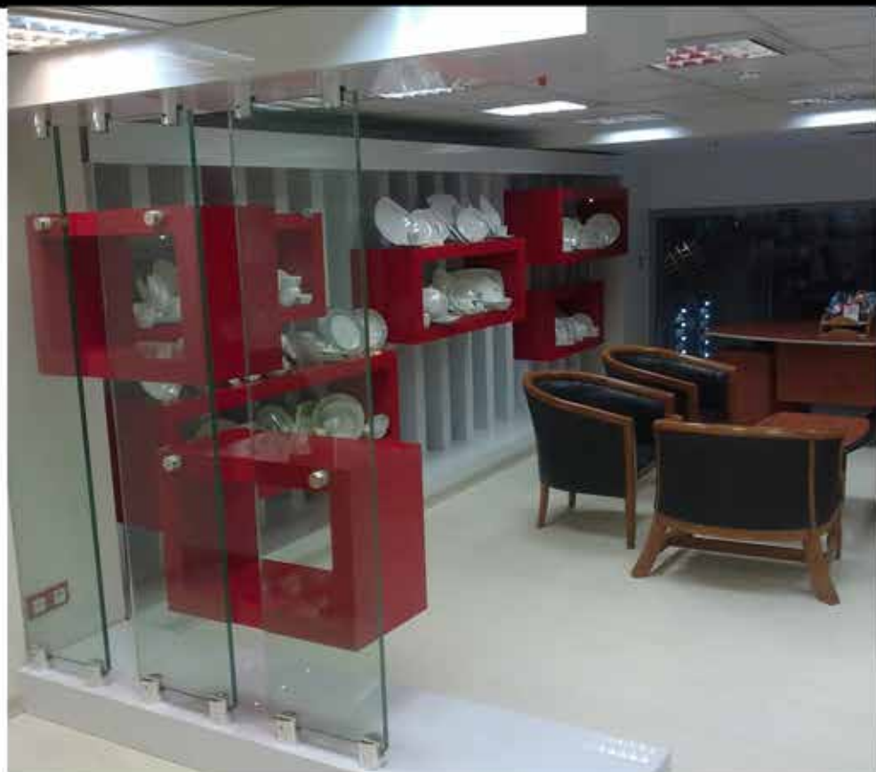
● فروشگاه مرکزی دینو